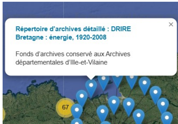
Géolocalisation des fonds d'archives concernant l'Ille-et-Vilaine

https://ressources.histoire-environnement.org/Carte?filtre=ressources