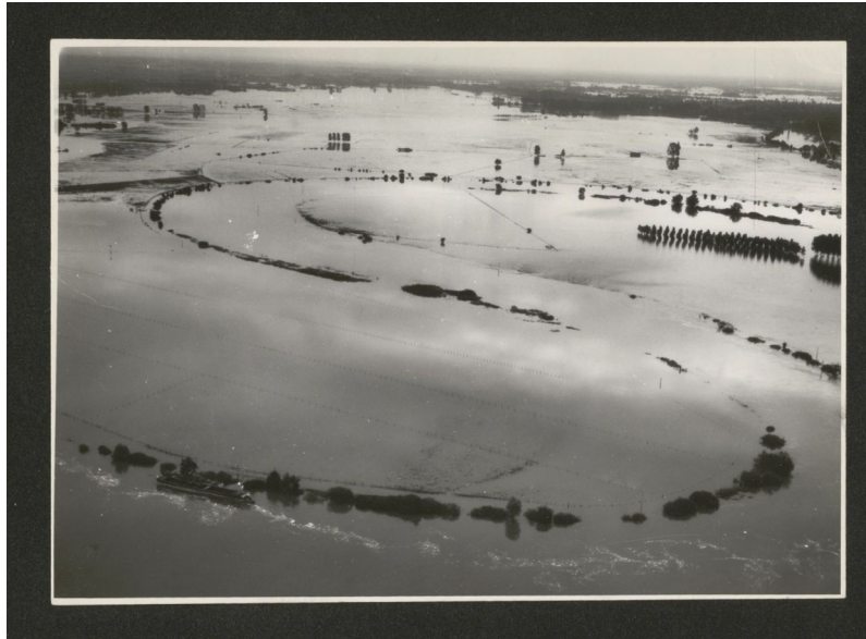
La Saône en crue lors de l'été 1968, vue aérienne. " l'été 1968 ? A peine croyable"