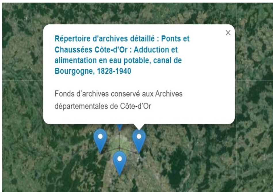
Géolocalisation des fonds d'archives concernant la Côte-d'Or

https://ressources.histoire-environnement.org/Carte?filtre=ressources